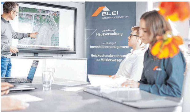
Die Büroräume von BLEI Immobilien sind nicht nur lichtdurchflutet, sondern auch mit hochwertigem Mobiliar ausgestattet. Topfpflanzen und Bilder mit Naturmotiven ergänzen das Ambiente optimal.