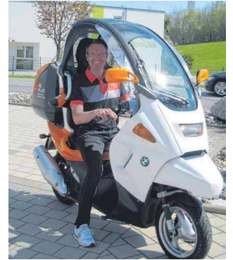
Der Firmenroller kann für geschäftliche Fahrten im Einzugsgebiet genutzt werden.