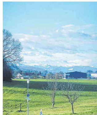
Bei klarer Sicht reicht der Blick vom Pfänder bis zum Säntis.